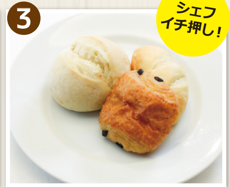
3 桐生酵母パン(1個)と プティパンセット(2個)