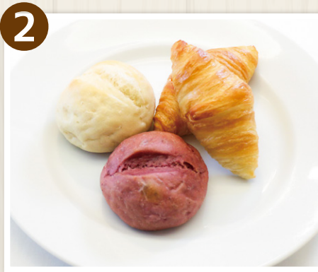
2 A.O.バターのカロワッサン(2個)と プティパン(2個)