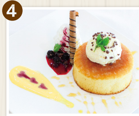
4 デザートパン ～スフレパンケーキアイスクリーム～