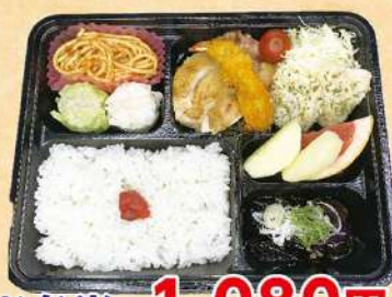
お弁当 1,080円 ～