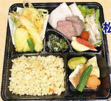
松花堂 2,180円 ～